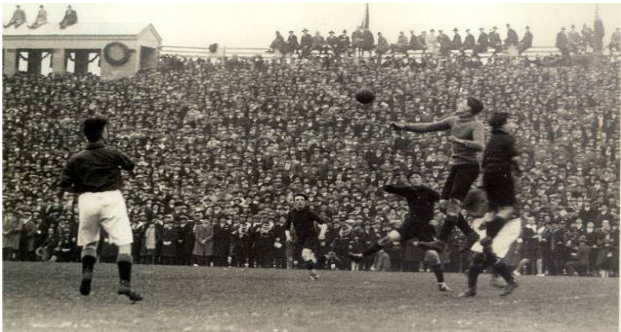
België-Nederland, 1 april 1928, stadion van R. Antwerp FC. Coverillustratie van het boek Veiligheid bij Voetbalwedstrijden.