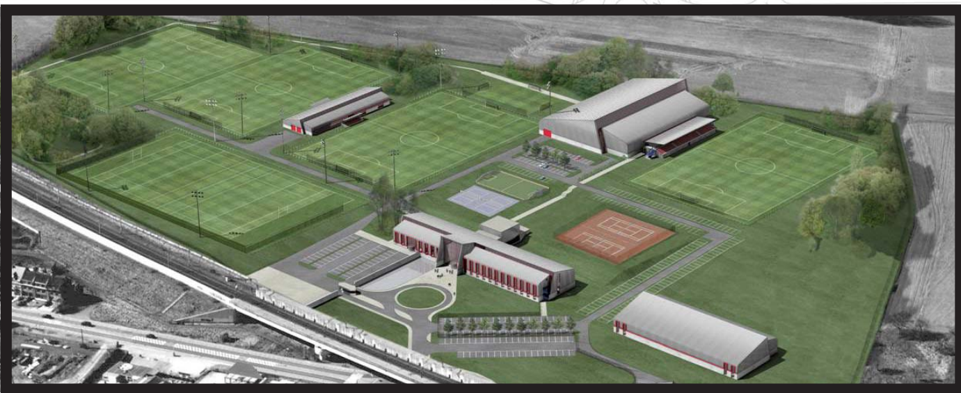
Centre technique national de football EURO 2000, ASBL / Nationaal Technisch Voetbalcentrum EURO 2000, V.Z.W.; n° TVA: en demande Siège social : Palais provincial de la Province du Brabant wallon, Chaussée de Bruxelles 61, 1300 Wavre